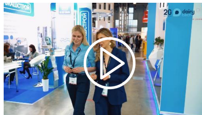
Интервью с директором выставки Dairy Tech