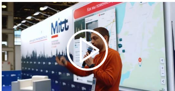
Отчётный ролик деловой программы MITT 2022