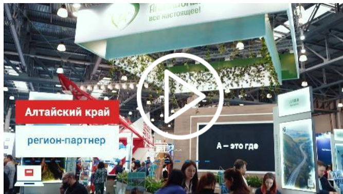
Отчётное видео о выставке MITT 2022